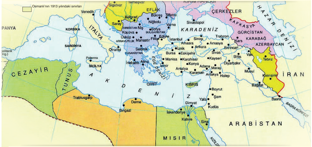
20. yüzyılın başında Osmanlı Devleti

1911'de başlayan Trablusgarp Savaşı'yla Osmanlı Devleti, Kuzey Afrika'daki son toprak parçasını kaybetmiştir (Trablusgarp ve Bingazi). Bu savaş devam ederken 1912'de Balkanlar'da Osmanlı Devleti'nden ayrılan Sırbistan, Karadağ, Bulgaristan ve Yunanistan birleşerek I. Balkan Savaşı'nı başlatmış bu savaşta Osmanlı Devleti, Makedonya, Batı Trakya, Edirne ve Kırklareli'yi kaybetmiştir. II. Balkan Savaşı'nda Edirne ve Kırklareli geri alınmıştır.