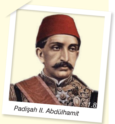
Padişah II. Abdülhamit

Osmanlı Devleti'nde 20. yüzyıl başlarında, II. Meşrutiyet'in ilanından sonra başlayan toprak kayıpları artarak devam etmiştir. Bu dönemde art arda yaşanan savaşlar Osmanlı Devleti'ni iyice güçsüz duruma düşürmüştür.