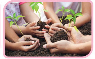
3. Ağaç dikme kampanyası

Verilenlerden hangileri okullarda düzenlenen sosyal yardımlaşma ve dayanışma çalışmalarına örnek verilebilir?