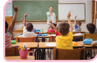
1. Okul kurallarına uyma kampanyası