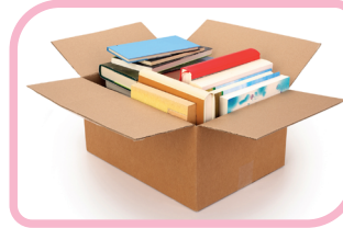
2. Kitap toplama kampanyası