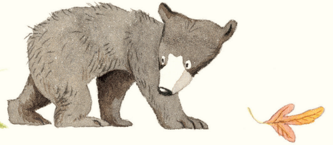
Ortanca yavru ayı.